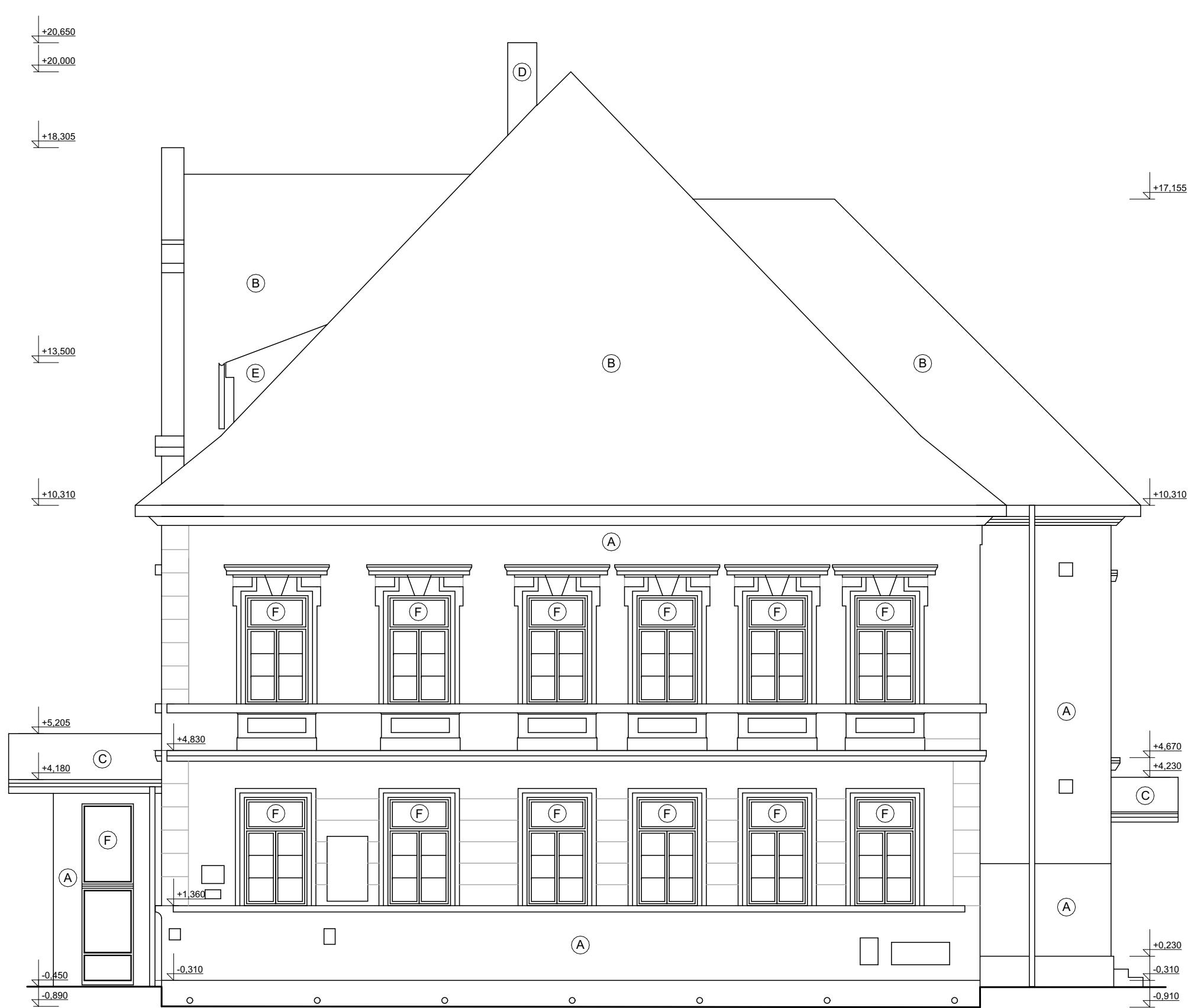
Pohled z východu